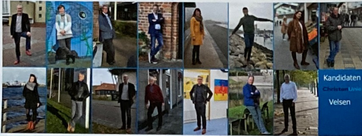
Kandidaten ChristenUnie Velsen

Website: https://ijmond.christenunie.nl Email: fractie@velsen.christenunie.nl